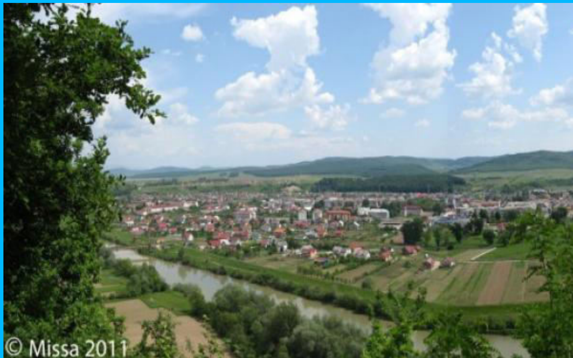
Panoramă a orașului Beclean (fotografie realizată de pe malul drept al râului Someș)

Nivelul pânzei de apă freatică, în funcție de formațiunile geo-morfologice, este cuprins între 0,8 – 7 metri adâncime.