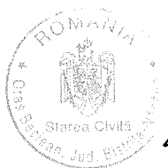
MUREȘAN MARIANA Ofițer de stare civilă*