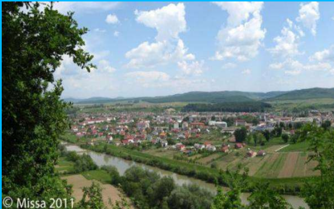
Panoramă a orașului Beclean (fotografie realizată de pe malul drept al râului Someș)

Nivelul pânzei de apă freatică, în funcție de formațiunile geo-morfologice, este cuprins între 0,8 – 7 metri adâncime.